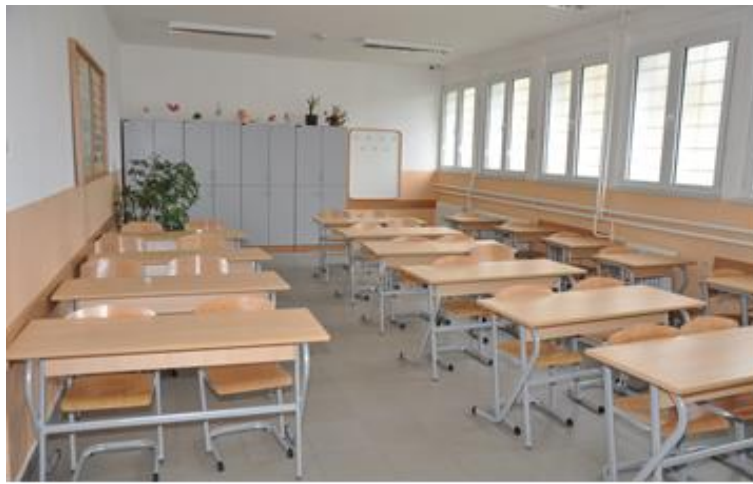
Кабинет биолошко - медицинске групе предмета