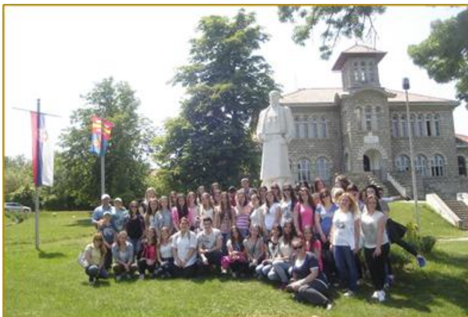
Са једног тематског часа

У току школске 2017/18. године ученици су узели учешће у свим активностима које организује Технолошка школа. Бројна су такмичења, приредбе, ученичка предузећа и остале активности где су ученици у велком броју учествовали и за своје активности били награђени и похваљени.