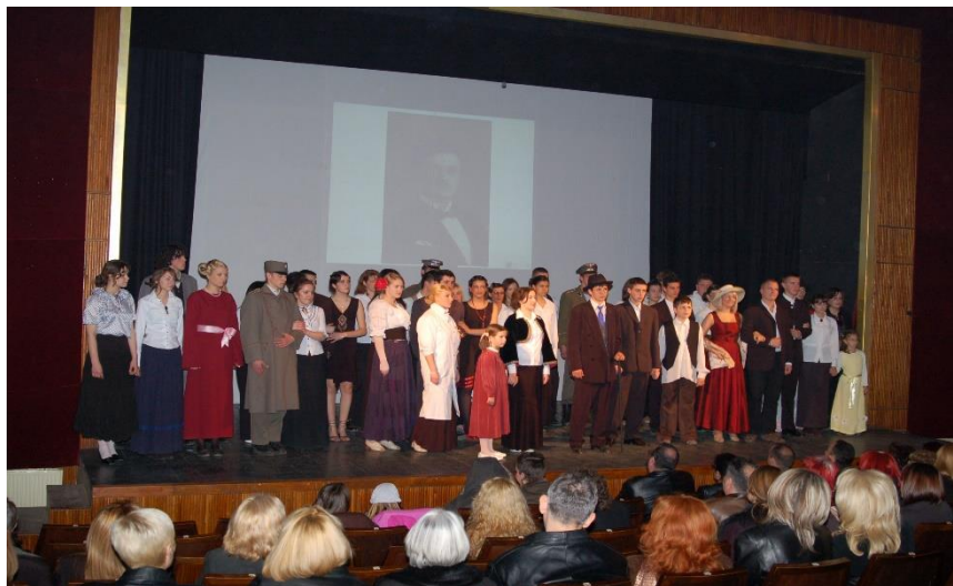
Приредба поводом Дана школе