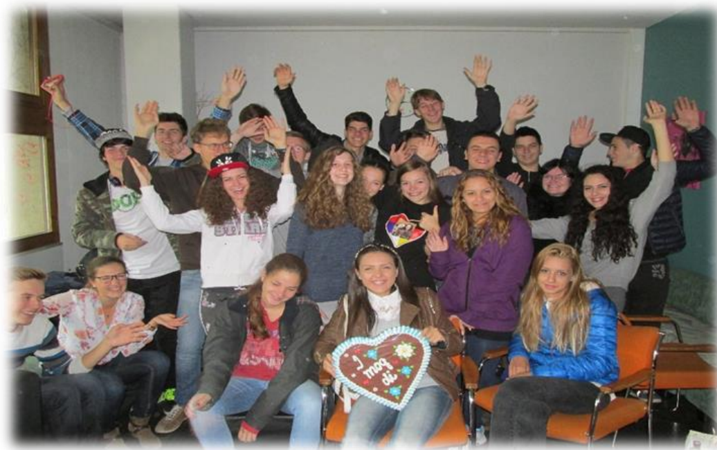
Ученици Технолошке школе и Гимназије „Св.Ана“ из Аугзбурга

У данашњем времену сви морамо бити свесни да је одговарајућим коришћењем разних медија могуће учинити много више него директном презентацијом програма стручне школе по основним школама.