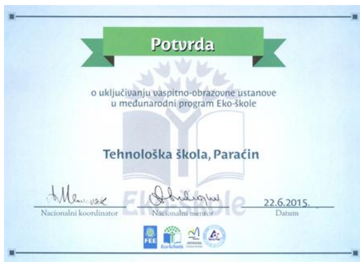
Потврда статуса међународне Еко – школе

Технолошка школа је средње стручна школа, која има за циљ да оспособи ученике за обављање занимања за која се школују. Мисија школе је да ученицима пружи трајна, функционална и по садржају актуална знања, да развија и подстиче иницијативност, тимски рад и позитивну комуникацију. С обзиром да је школа и васпитна установа циљ нам је да делујемо и у том правцу и превентивно утичемо на појаву деликвентног понашања и болести зависности и очувања животне средине.