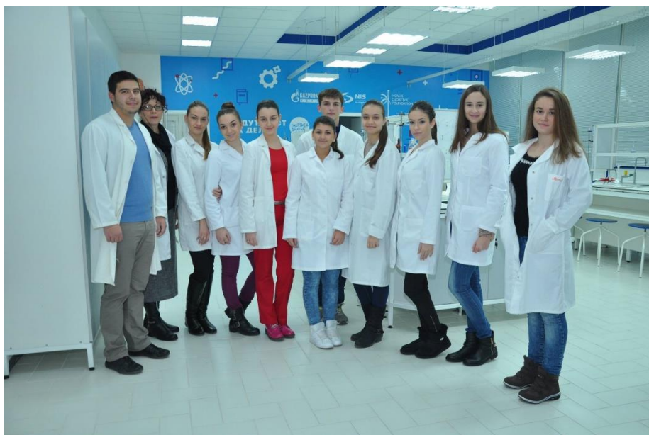
Прва генерација уписана школске 2014/15. године