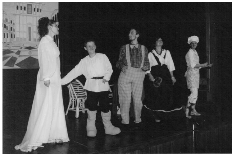
Представа „Ромео и Јулија“