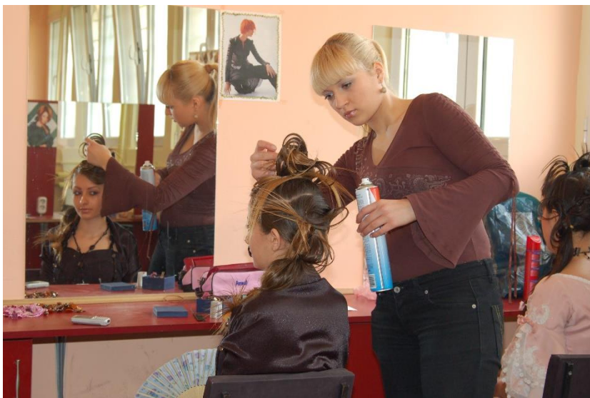
У школском салону

Школске 2006/07. године Технолошка школа је била домаћин 12. Републичког такмичења за Мушке и Женске фризере и Маникире.