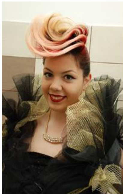
Са једног од такмичења