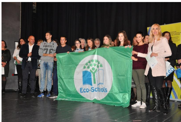
Технолошка школа „Еко- школа“