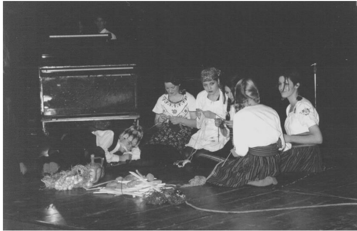
Приредба поводом Светог Саве

На крају сваке школске године матуранти организују ревије матурских радова у сали Позоришта Параћин.