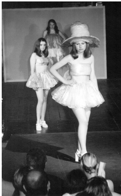
Ривија матурских радова ученика образовног профила конфекцијски техничар сала градског позоришта

У периоду од 1966/67. до 2000/2001. године школа је за потребе индустрије вунених тканина “Бранко Крсмановић” образовала ученике за рад у предионици, ткачници, доради, конфекцији и трикотажи. У том периоду ученици су учествовали на савезним такмичењима, организовали ревије, изложбе и на различите начине презентовали своје практичне радове.