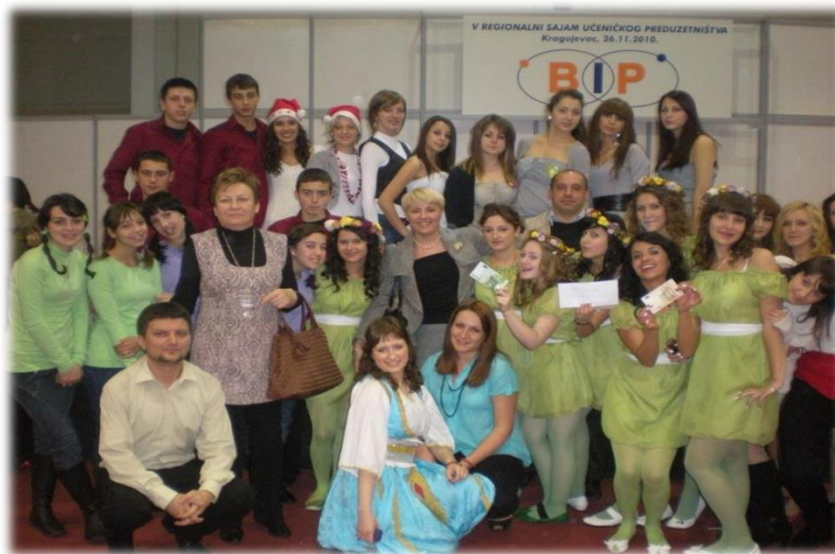
Са сајмова Ученичког предузетништва

На спортским такмичењима школа редовно учествује и постиже запажене резултате, нарочито на општинским, где смо у индивидуалним спортовима најуспешнији.