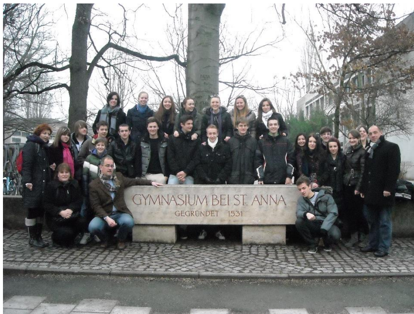
Међународна сарадња са ученицима гимназије „Св Ана“ из Аугзбурга у Немачкој