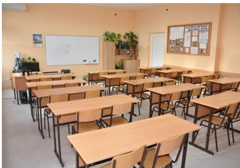
Кабинети опшеобразовних предмета