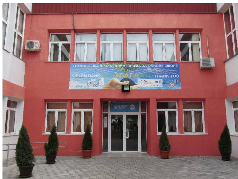
Технолошка школа - наша школа

Желимо да постанемо школа у коју ученици и наставници радо долазе, јер је настава у њој савремена, квалитетна и прилагођена потребама и интересовањима ученика и наставника.