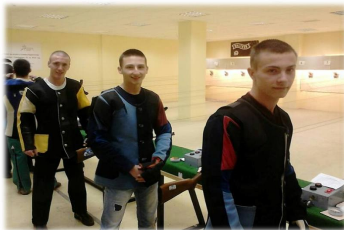
Стрелци на Републичком такмичењу

На спортским такмичењима школа редовно учествује и постиже запажене резултате, нарочито на општинским, где смо у индивидуалним спортовима најуспешнији.