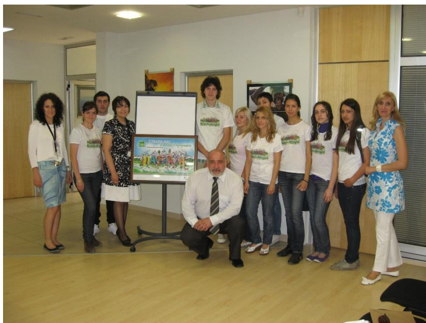
Пројекти са фабриком цемента ЦРХ (Србија) д.о.о